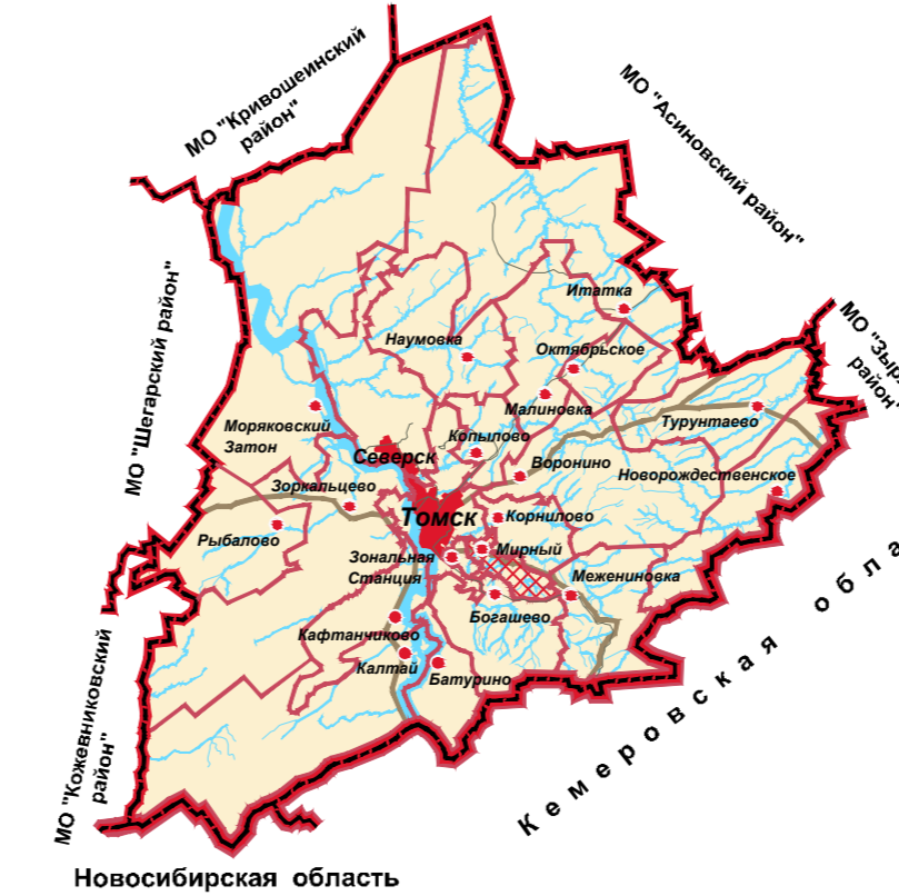
Схема размещения Мирненского сельского поселения в структуре МО "Томский район"